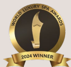
Luxury Spa Group Europe