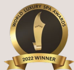
Global Winner as Best Spa Development Group