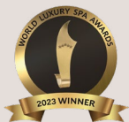
Best Luxury Spa Group Southern Europe