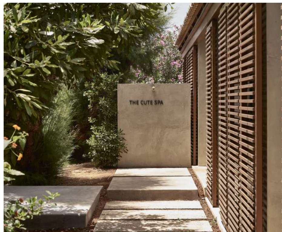
The Cute Spa

Продолжите уход дома с помощью Body Scrub with Cretan Herbs