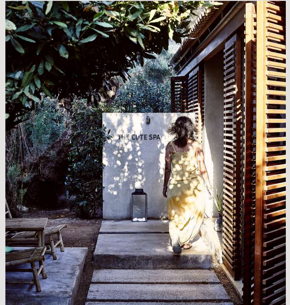
The Cute Spa

Продолжите уход дома с помощью Sunscreen Face & Body Cream 30 SPF Face Cream with Antiaging Factors